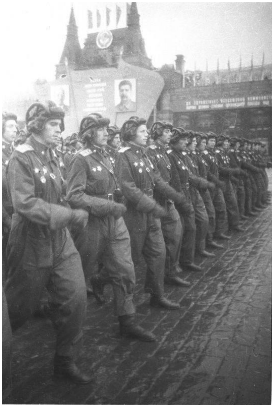
Парад Победы. Строй офицеров-танкистов