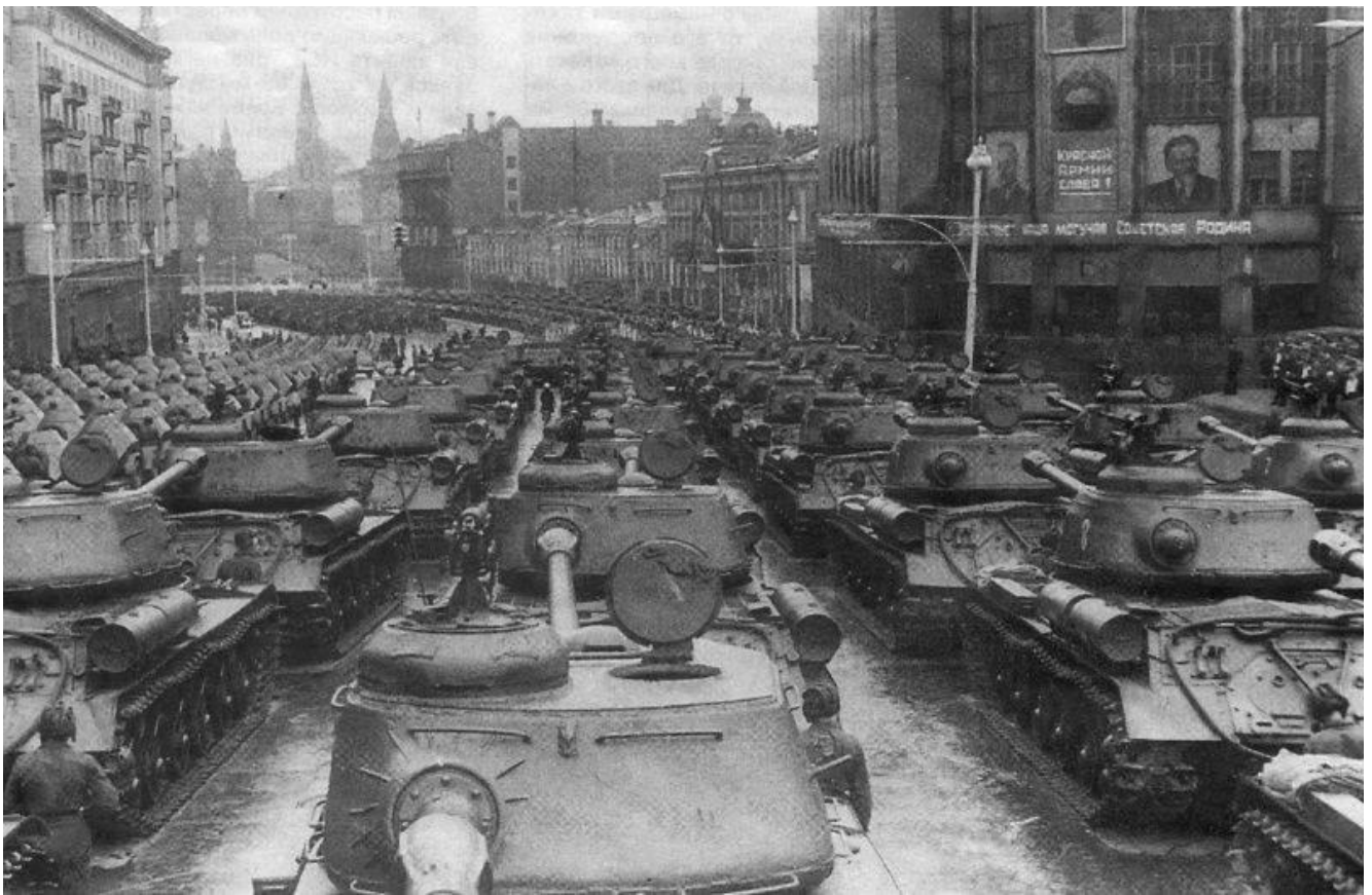
Танки ИС-2 перед вступлением на Красную площадь