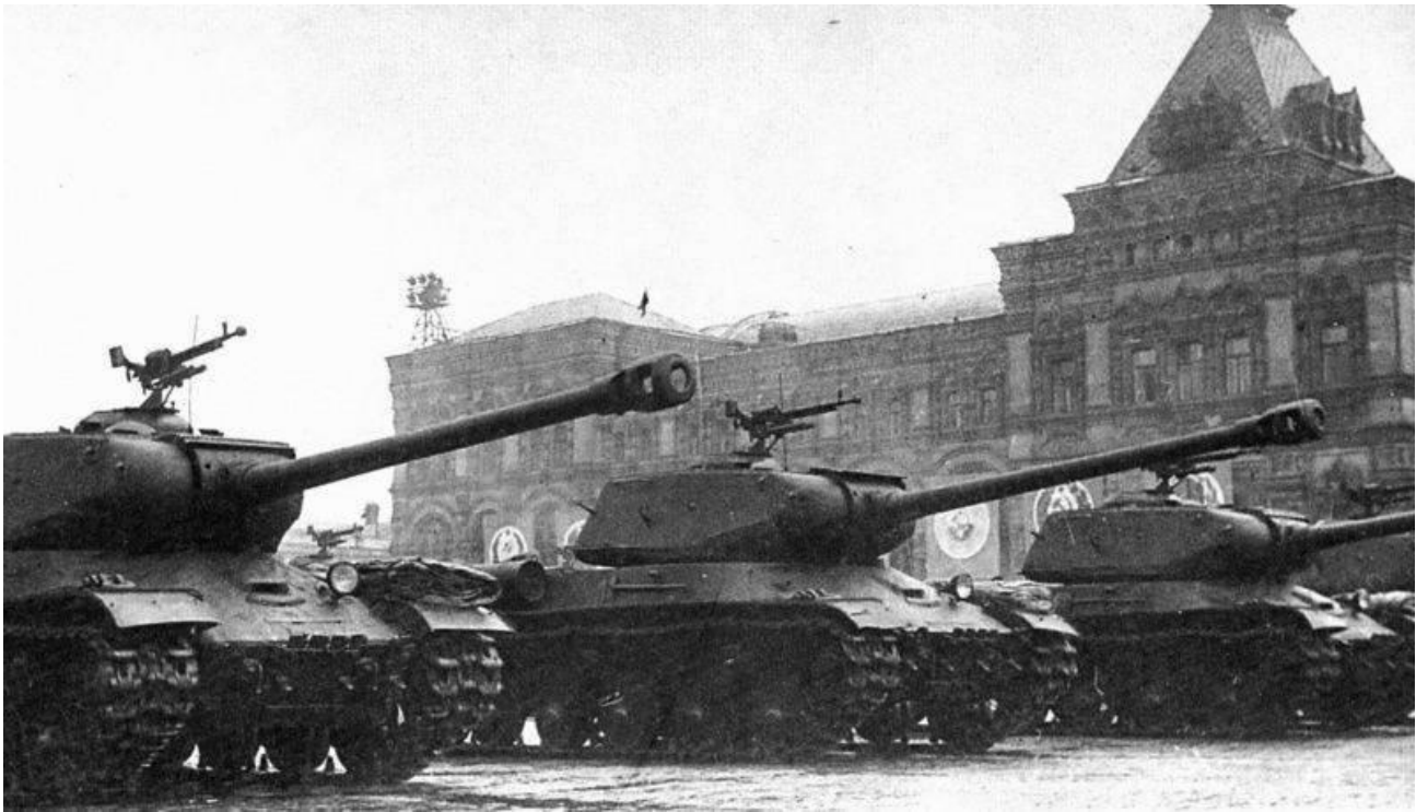
Тяжелые танки ИС-2 проходят по Красной площади во время парада в честь Победы 24 июня 1945 года