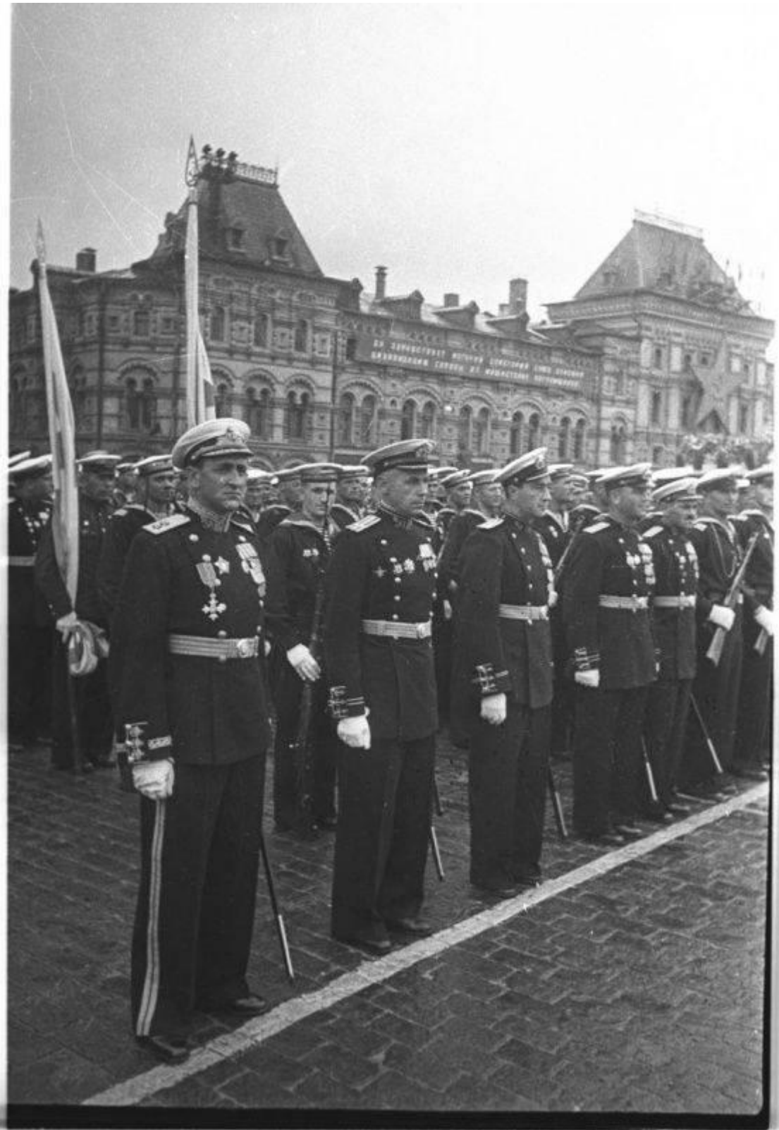
Парад Победы. Строй моряков