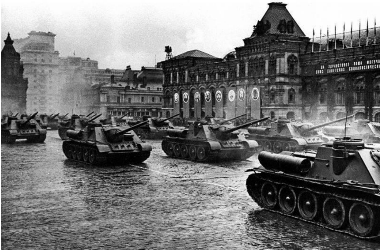
Парад длился 2 часа под сильным дождем. Однако людей это не смутило и праздник не испортило. Играли оркестры, праздник продолжался. Поздно вечером начался праздничный салют. В 23 часа из 100 аэростатов, поднятых зенитчиками, залпами полетели 20 тыс. ракет. Так завершился этот великий день. 25 июня 1945 г. в Большом