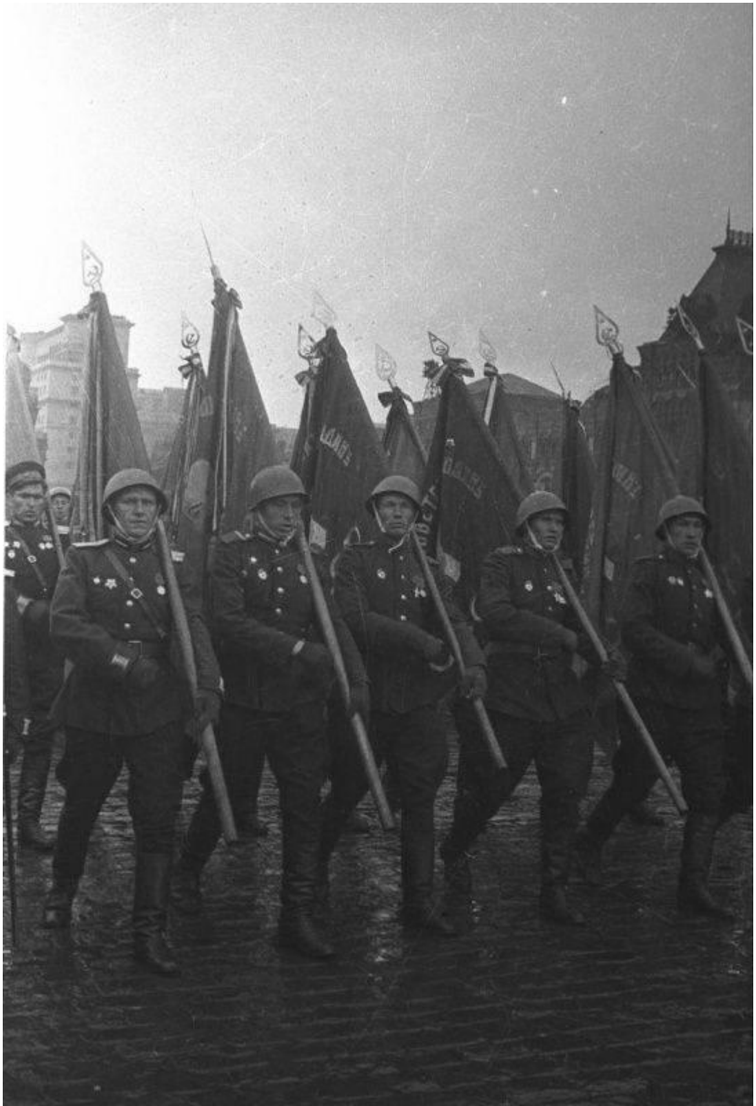
Парад Победы. Знаменосцы