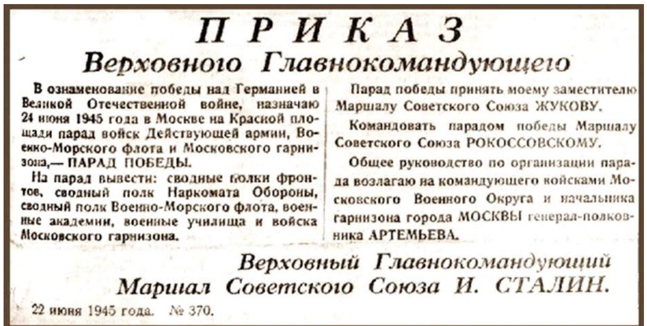
22 июня 1945 года в центральных газетах Союза был опубликован приказ Верховного главнокомандующего №370.