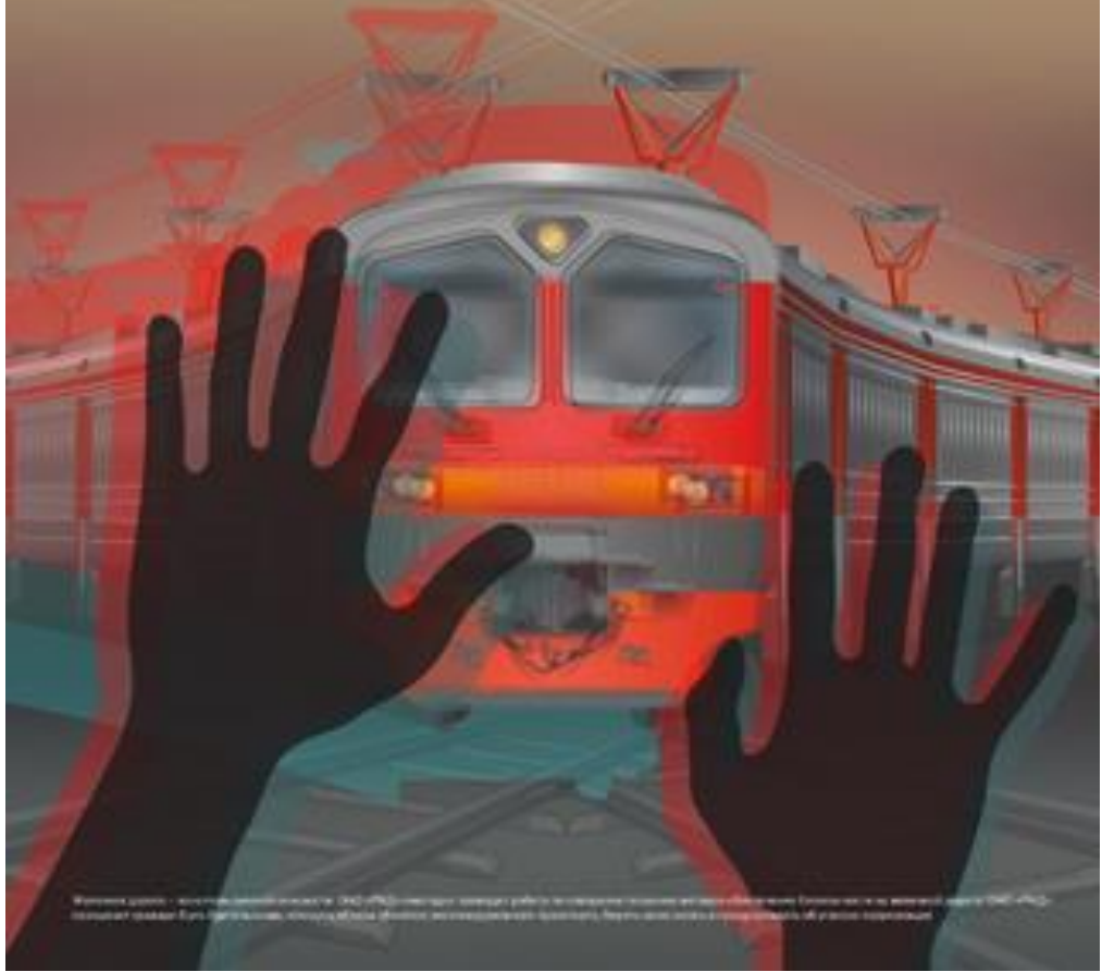
Иллюстрация создана в соответствии с требованиями РЖД к созданию единого визуального языка. РЖД – это железная дорога России. РЖД – это безопасность. РЖД – это комфорт. РЖД – это надежность. РЖД – это качество.

случаев травматизма на железной дороге за 2021 г.