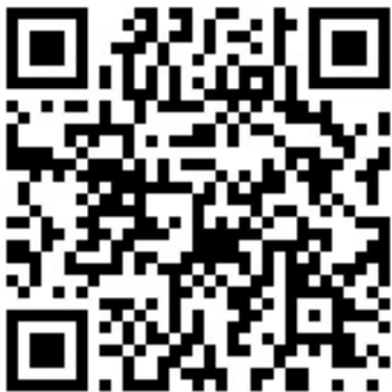
ПАО «Россети Ленэнерго»

Вы можете ознакомиться с информацией о плановых и аварийных отключениях электроэнергии на сайте ПАО «Россети Ленэнерго», на сайте «Портал-ТП.рф» и в мобильном приложении ПАО «Россети»